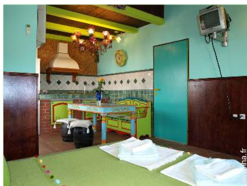
Appartement de Charme