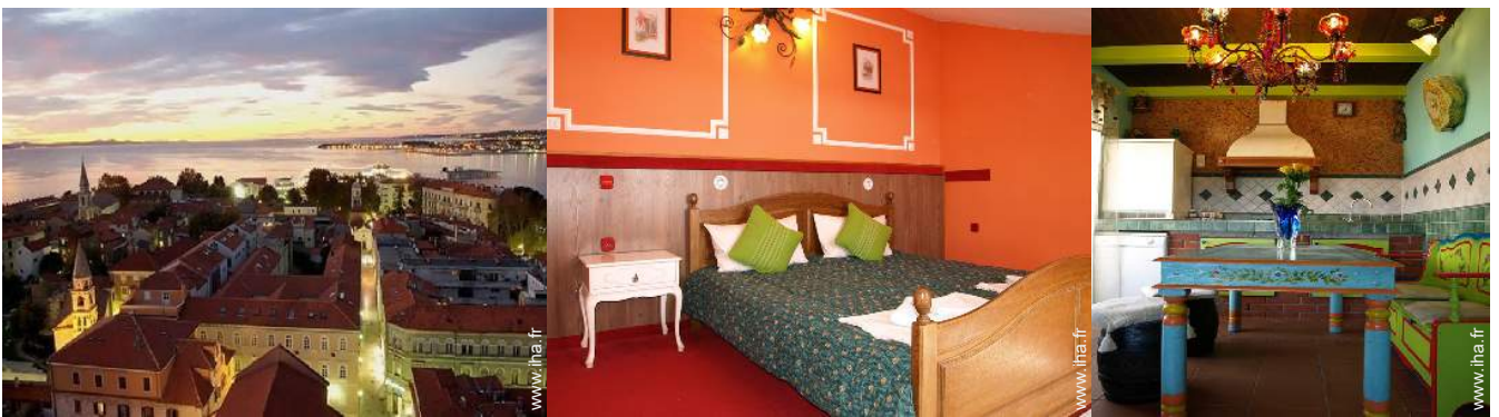
Villes à proximité