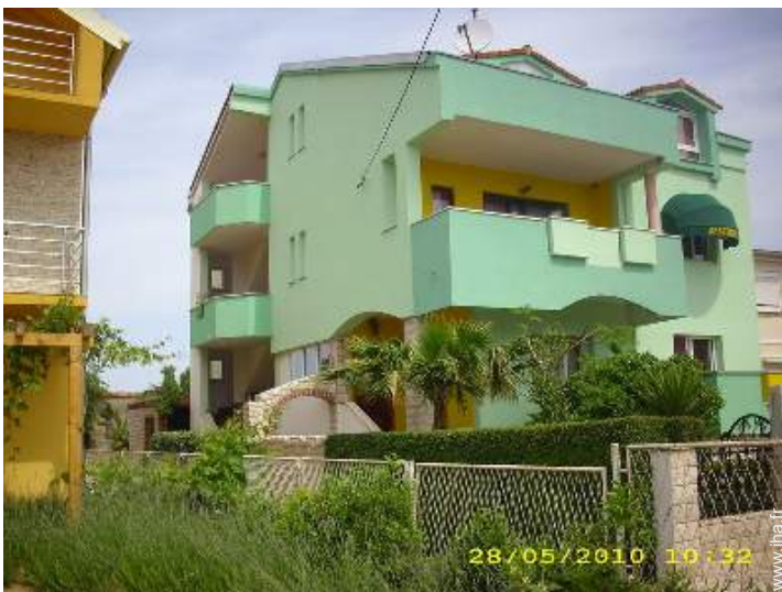
Propriété de Charme