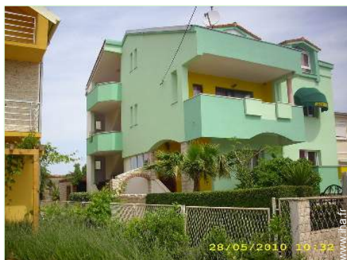
Propriété de Charme