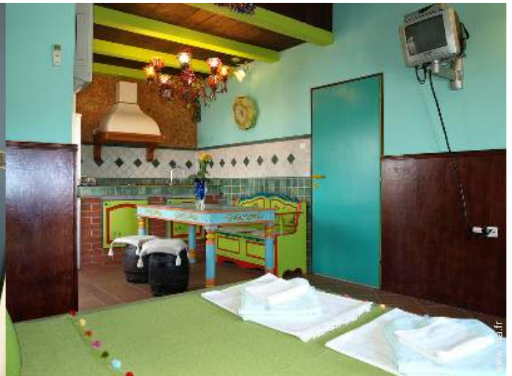
Appartement de Charme