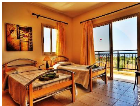
lits jumeaux simple