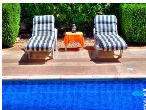
cabine de bronzage