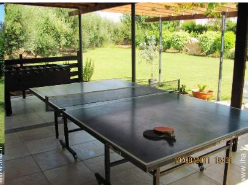
table de ping-pong