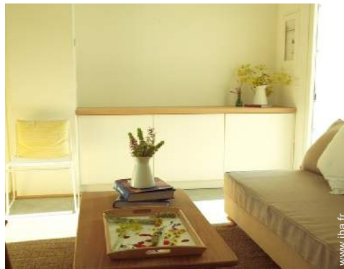
Bungalow de Prestige