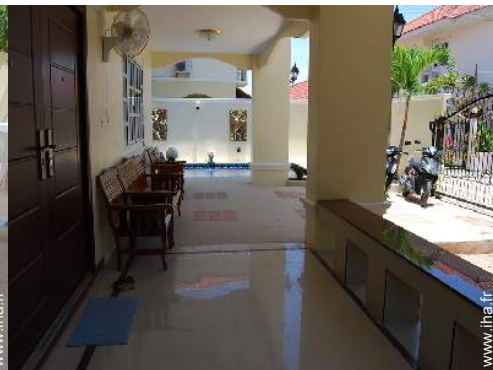
vue depuis le patio