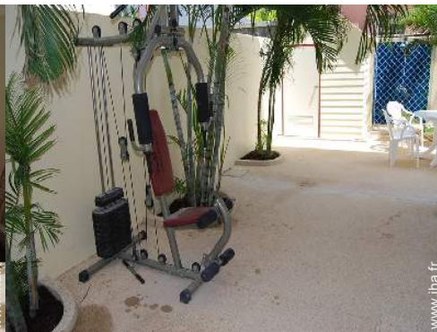
machine(s) de musculation