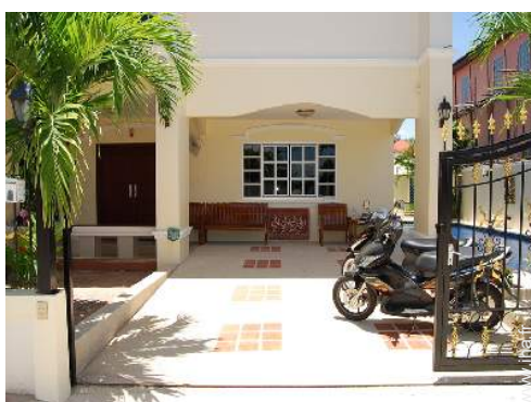
vue depuis le patio