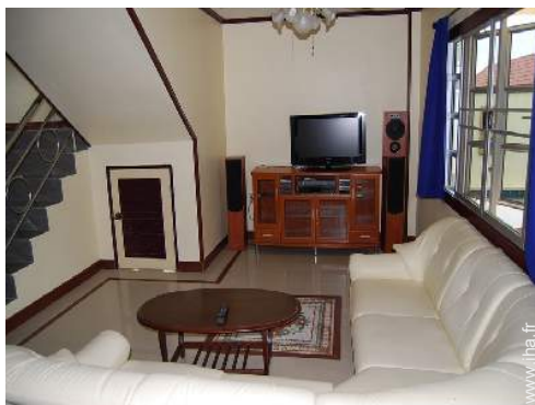
salon de musique