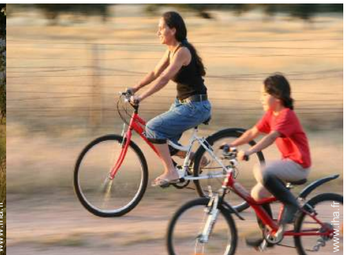
location de vélo/VTT