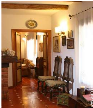
Agencement intérieur à disposition des hôtes