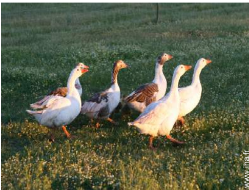
animaux de ferme