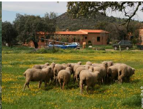
animaux de ferme