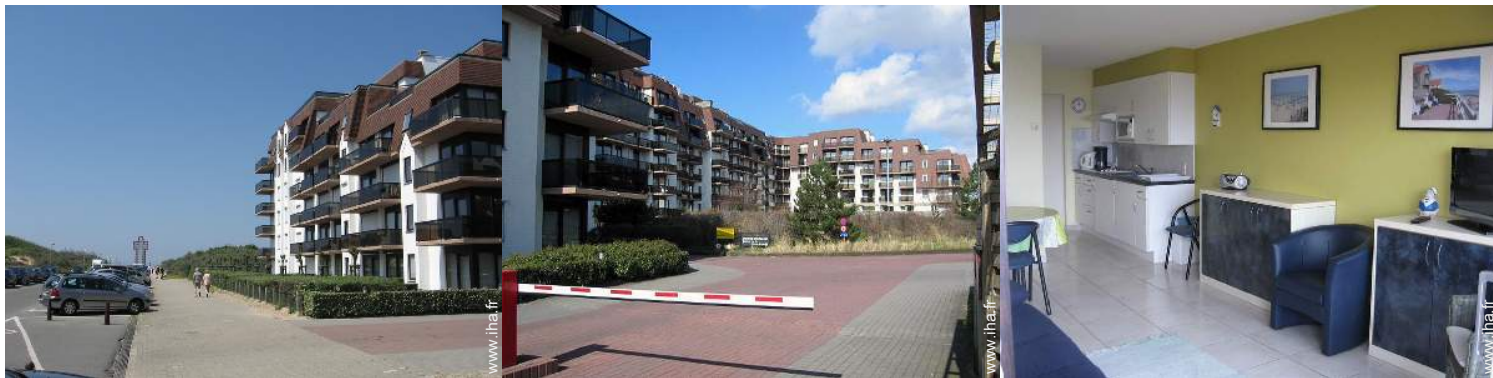
Résidence de standing