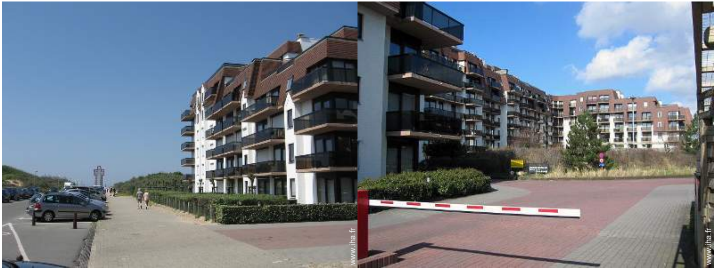
Résidence de standing