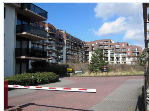
Résidence de standing