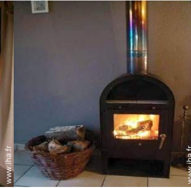
poêle à bois