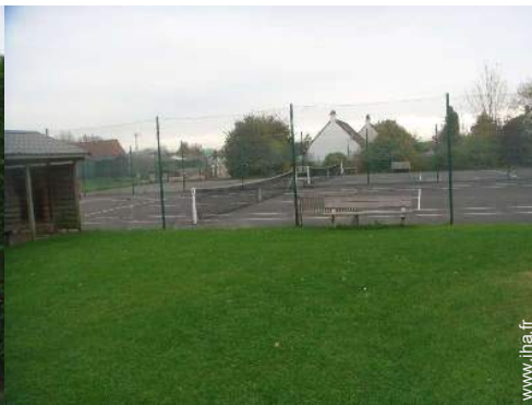
Tennis - surface dure