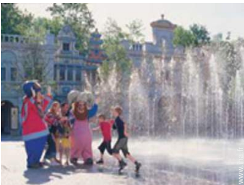
parc de loisirs