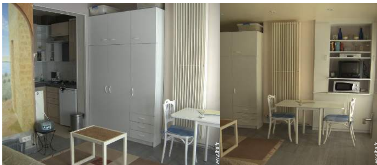
Studio de Charme