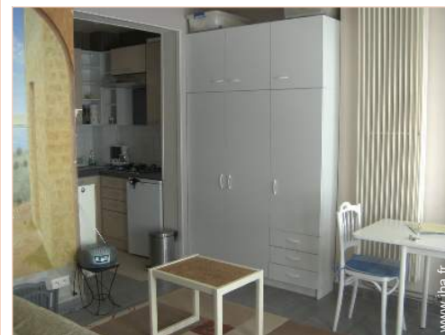
Studio de Charme