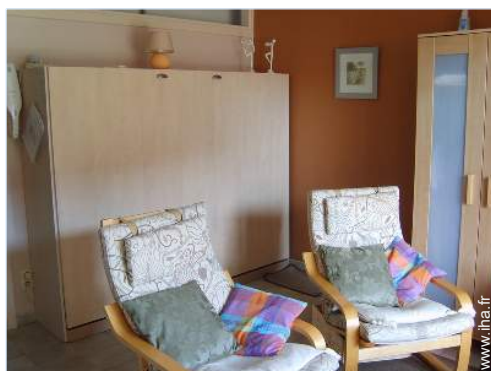
lit(s) escamotable(s) 2 pers