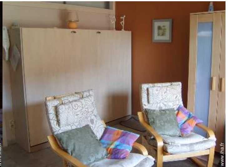
lit(s) escamotable(s) 2 pers