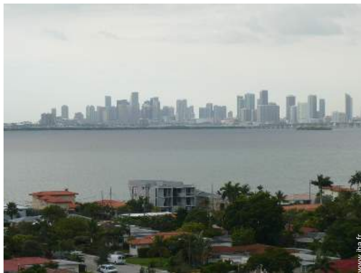
vue sur ville