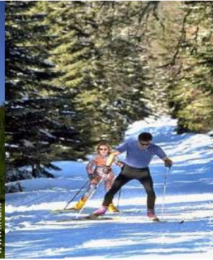
ski de fond