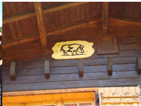
Les animaux de la maison