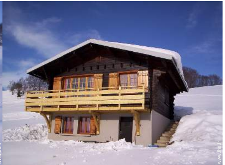
loisirs d'hiver à proximité