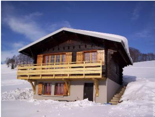
loisirs d'hiver à proximité