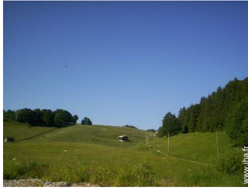
Chalet de Montagne