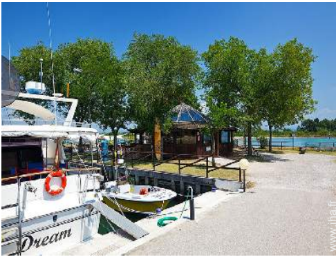
place de bateau au port