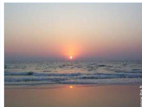
vue sur rue piétonne