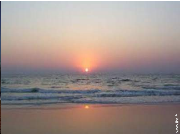
vue sur rue piétonne