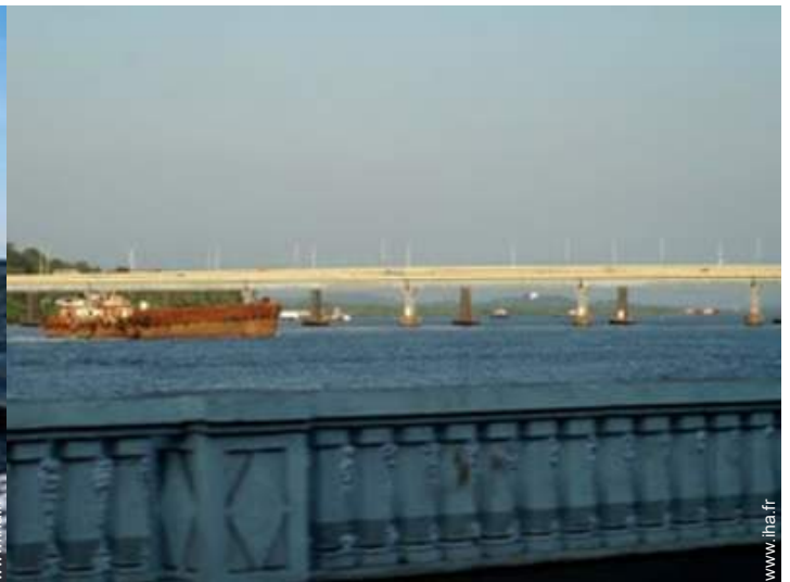
vue sur rivière