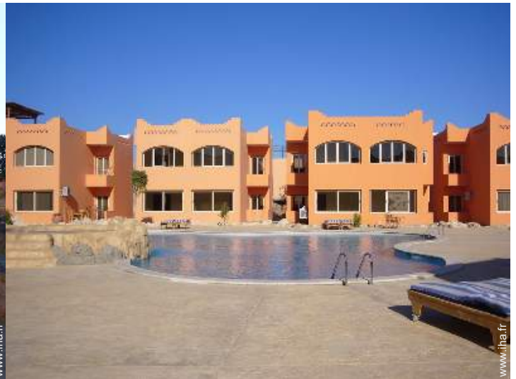
Résidence de standing