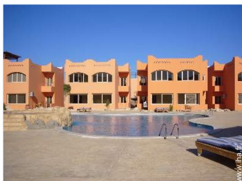
Résidence de standing