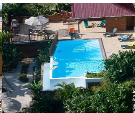
Piscine à débordement