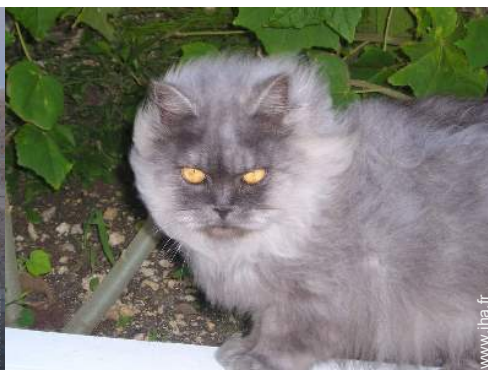
Les animaux de la maison