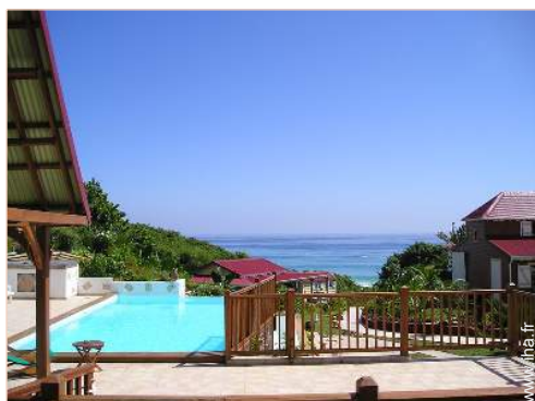
Piscine à débordement