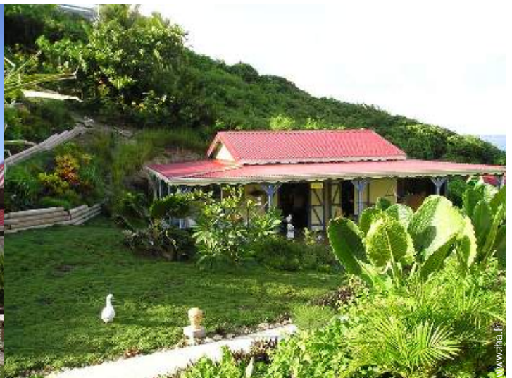
Maison de Charme en Bois