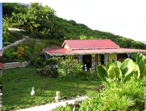
Maison de Charme en Bois