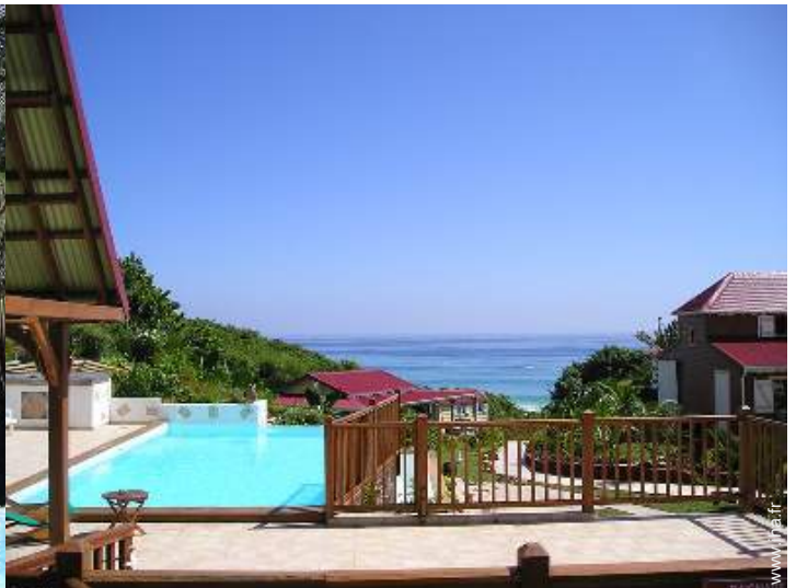
Piscine à débordement