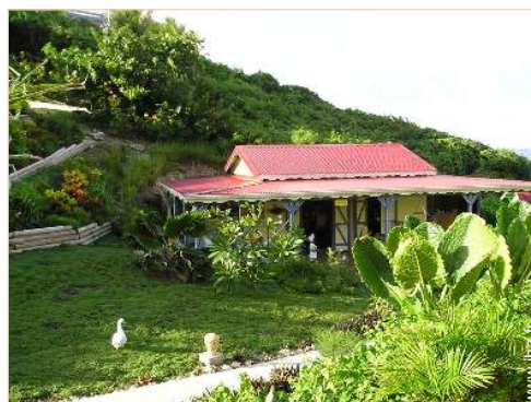
Maison de Charme en Bois