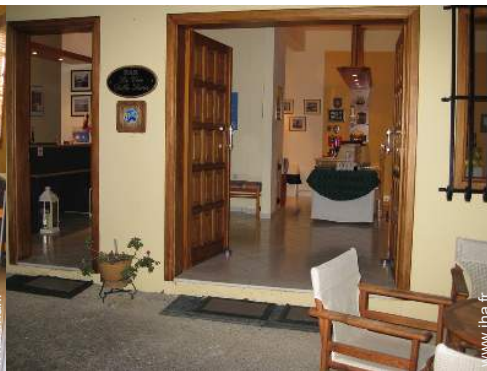
wifi (acces internet sans fil)