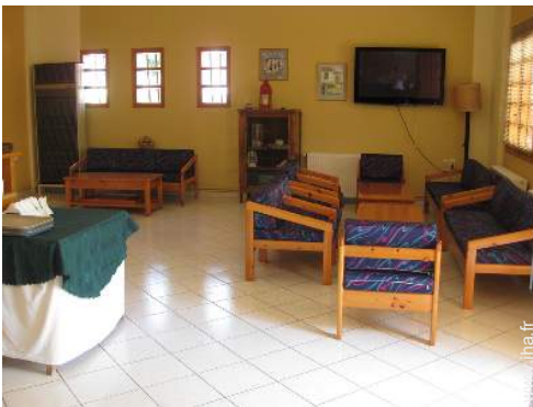
wifi (acces internet sans fil)