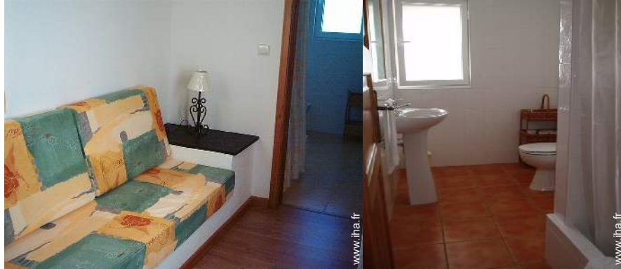
canapé-lit(s) 1 pers