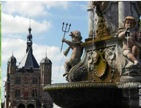
Villes à proximité