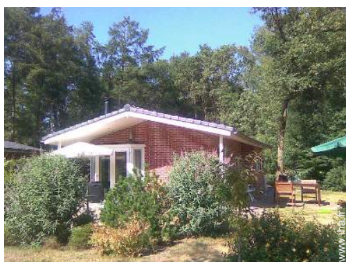
Cabanon de Charme