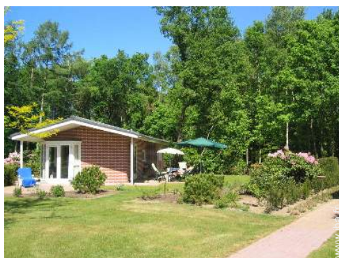
Cabanon de Charme