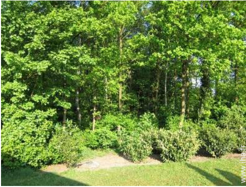
vue sur forêt