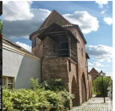
Villes à proximité