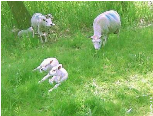
vue sur campagne