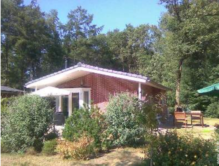
Cabanon de Charme