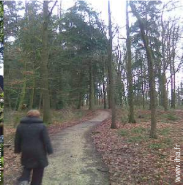
vue sur forêt