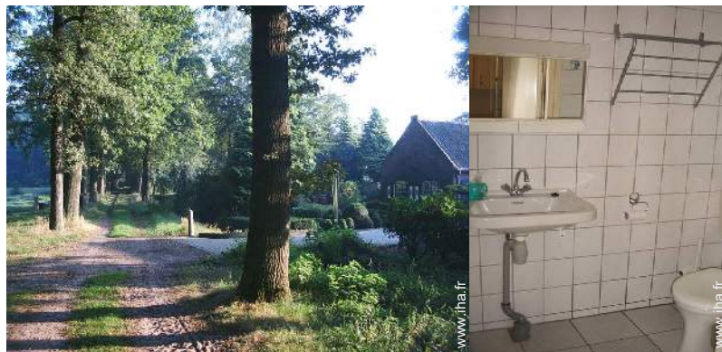
vue sur forêt