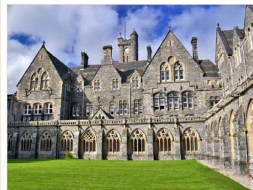
vue sur cour