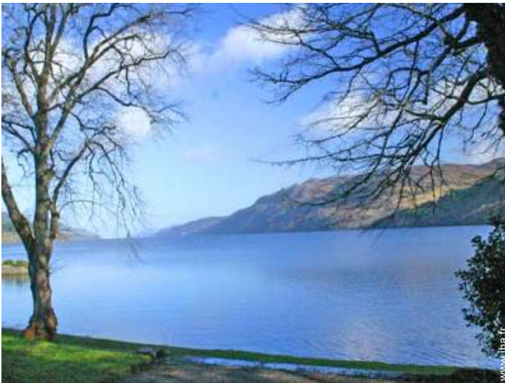
excursion en bateau