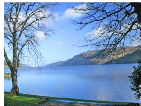
excursion en bateau