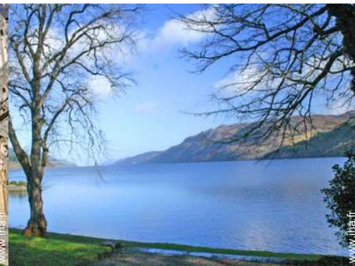
vue sur cour