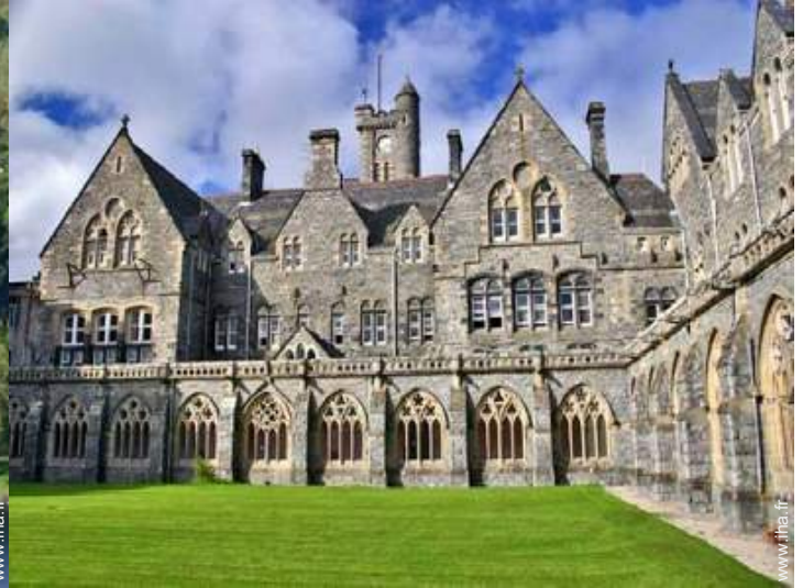
vue sur cour