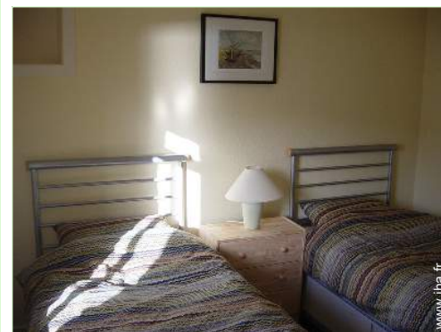
lits jumeaux simple