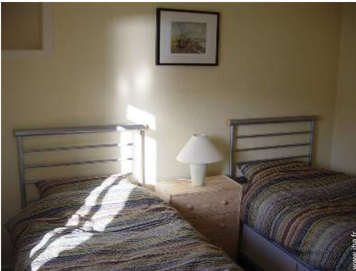
lits jumeaux simple