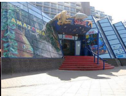
Attraites et détente