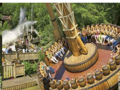
parc de loisirs