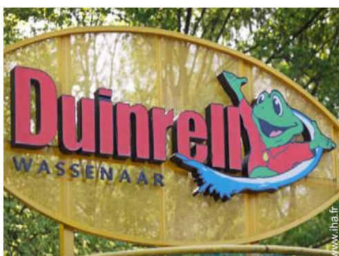
parc de loisirs