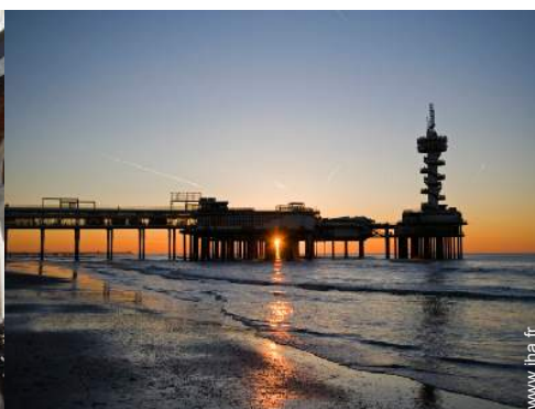
Attraites et détente