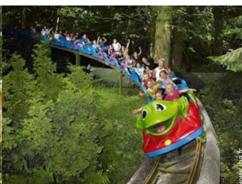
parc de loisirs