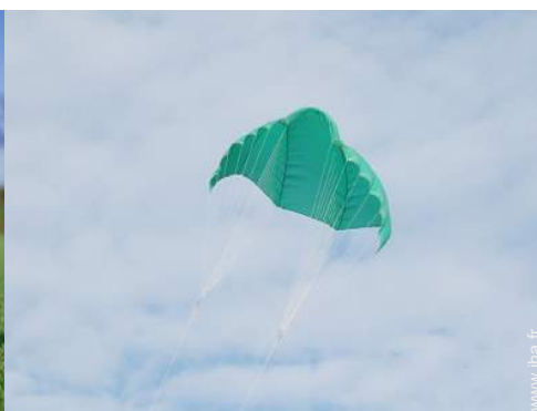
spot de windsurf