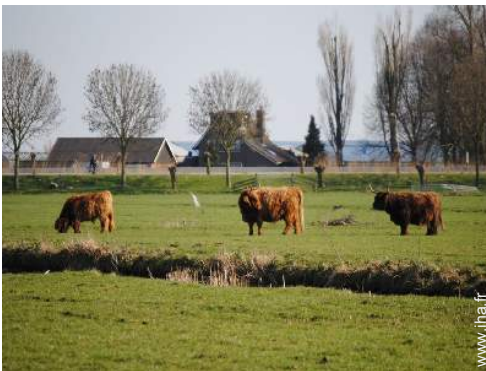
vue sur prairie