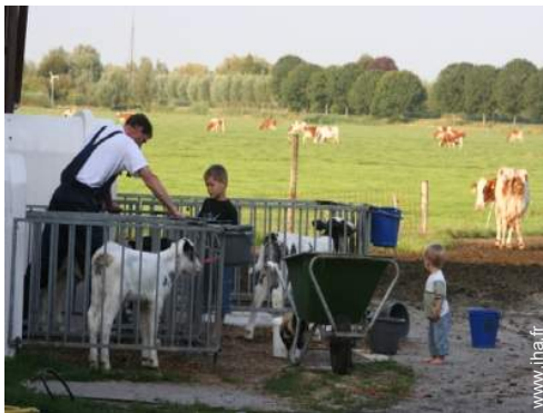
animaux de ferme