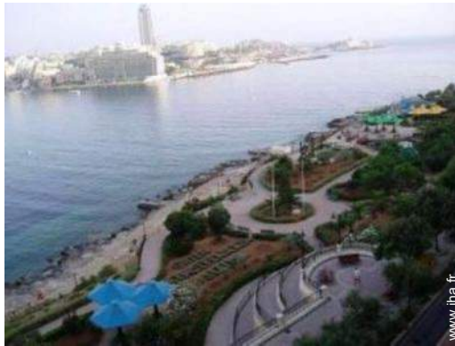
parc de loisirs