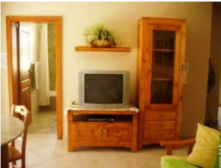
wifi (accès internet sans fil)