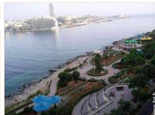
parc de loisirs