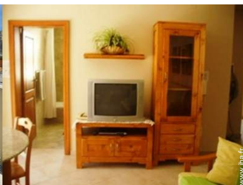
wifi (accès internet sans fil)