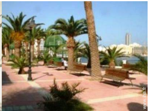
parc et jardin