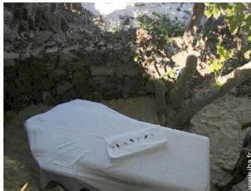
table de massage