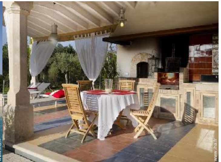
Propriété de Prestige