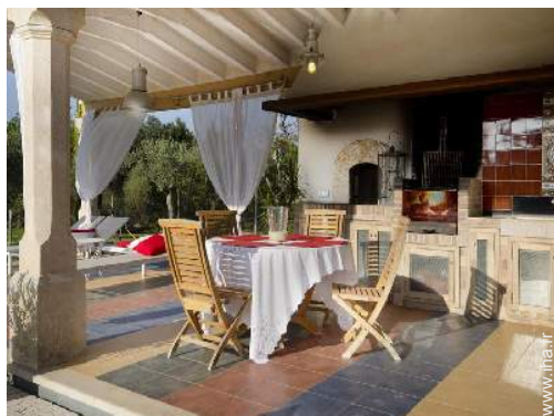
Propriété de Prestige