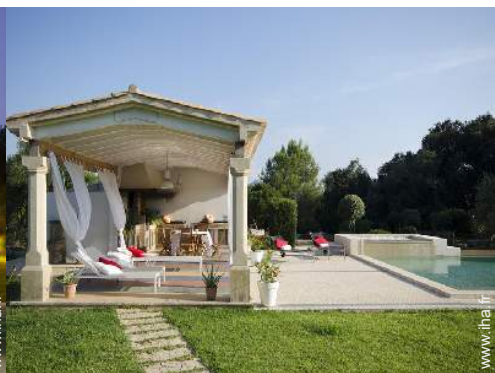
cabine de bronzage