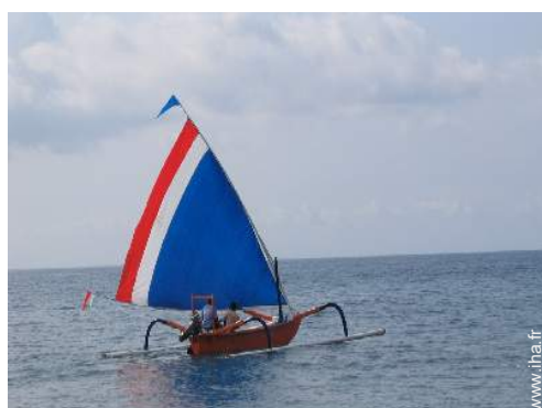
bateau à voile