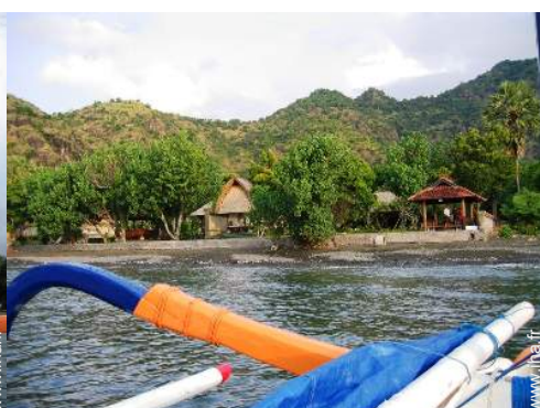
bateau à voile