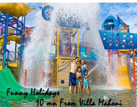
Funny Holidays 10 mn from Villa Mahoni