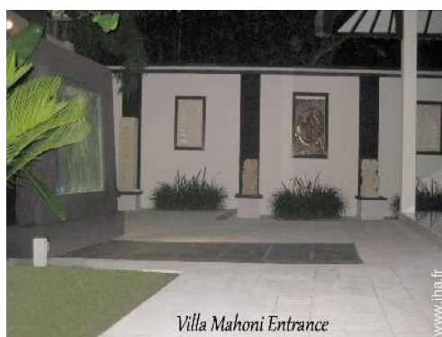
Villa Mahoni Entrance