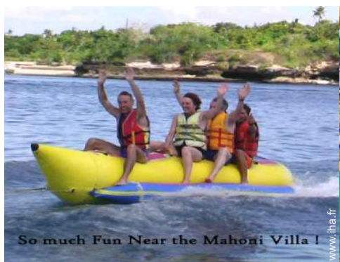
So much Fun Near the Mahoni Villa !