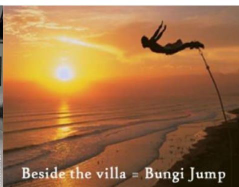
Beside the villa = Bungi Jump