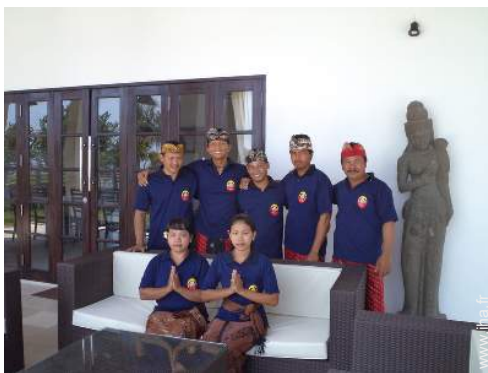
personnel de maison