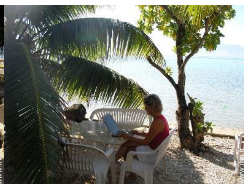
wifi (accès internet sans fil)