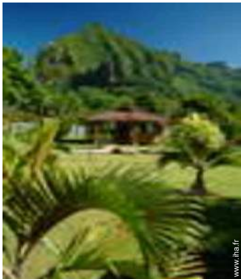
Bungalow de Prestige