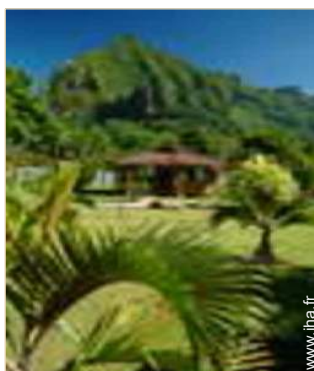
Bungalow de Prestige