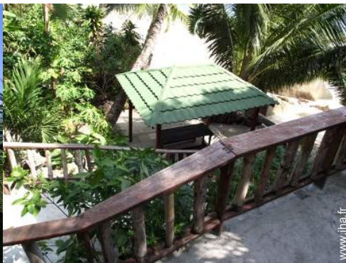
Equipements extérieurs à disposition des hôtes