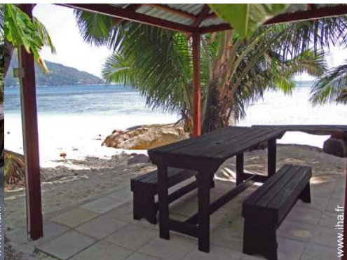
Installation extérieure à disposition des hôtes