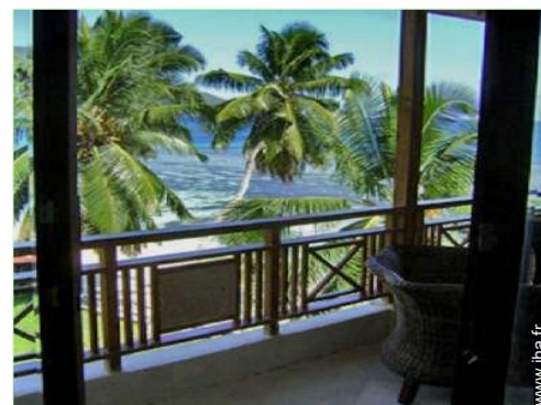
vue depuis la véranda

Barbecue, table(s) de jardin, salon de jardin, balancelle, douche extérieure