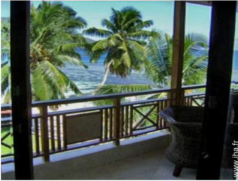
vue depuis la véranda