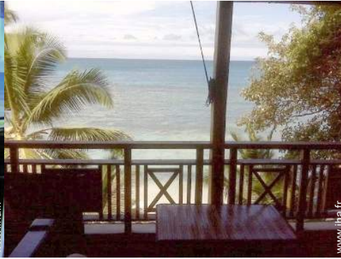
vue depuis la véranda