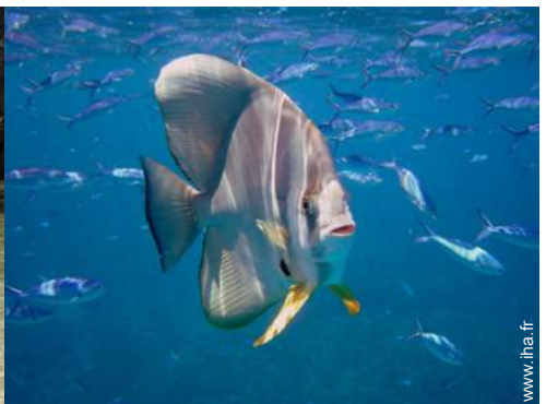
plongée avec tuba