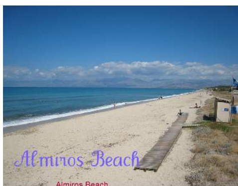
plage de galets