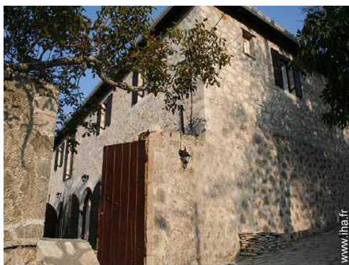
Maison de Prestige en Pierre