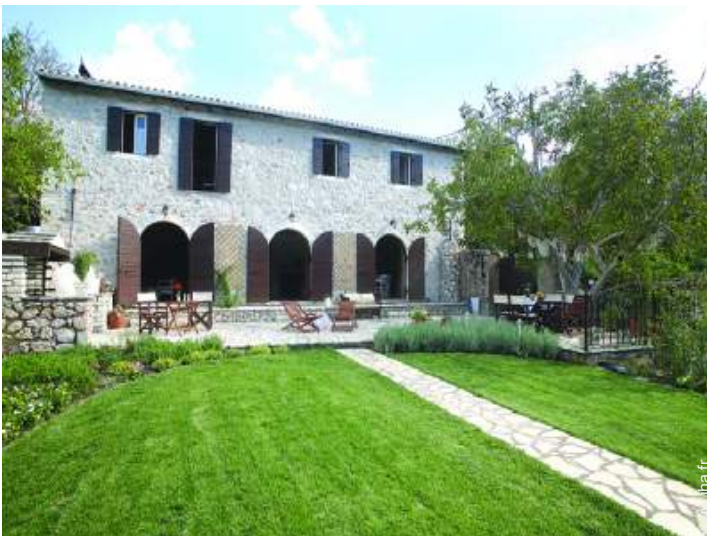
Gentilhommière de Prestige