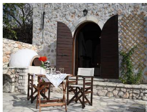
four à pizza