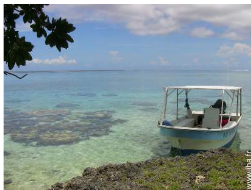
bateau à moteur