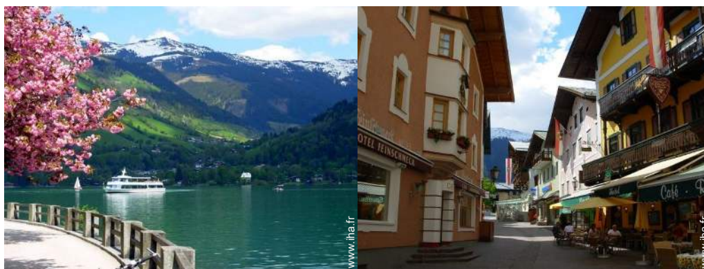
chemin de promenade