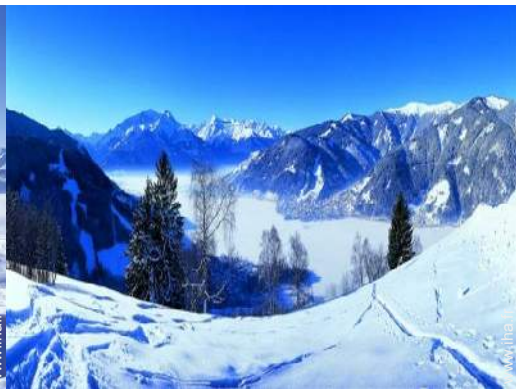
pistes de ski