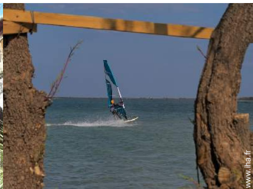
spot de windsurf