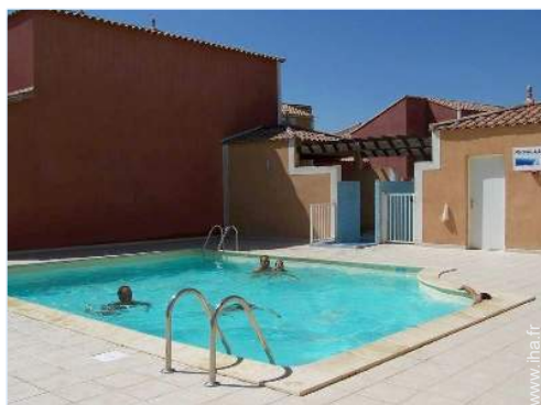
Installation extérieure à disposition des hôtes