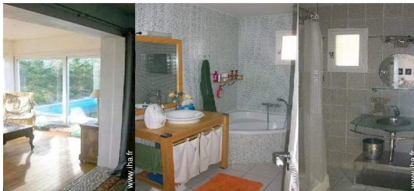
vue depuis la véranda