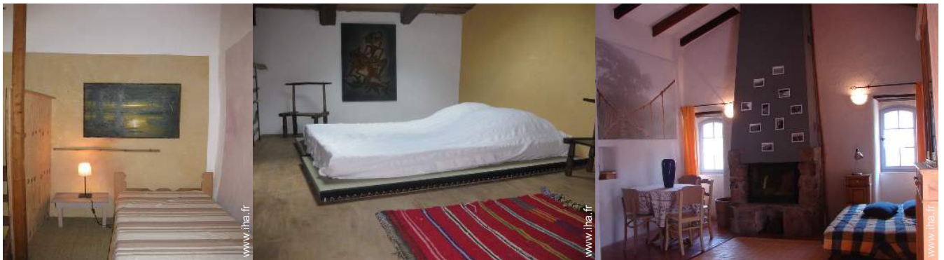
lit(s) futon 2 pers