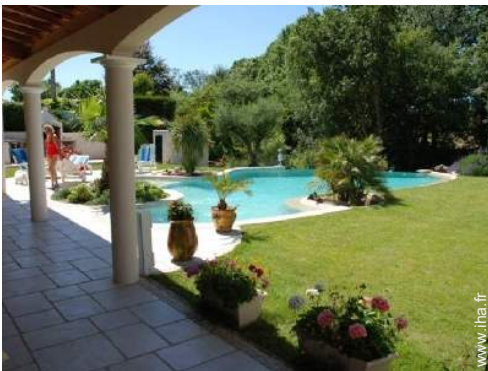
Piscine à débordement