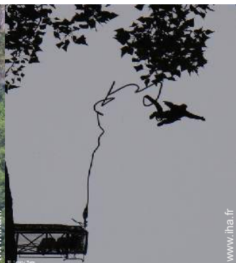
loisirs aériens à proximité