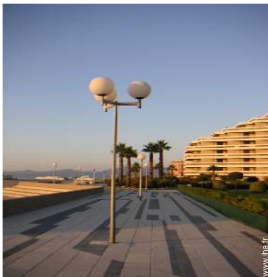
vue sur rue piétonne