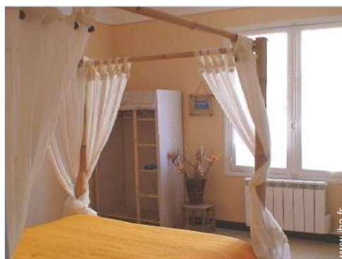
lit(s) double(s) à baldaquin