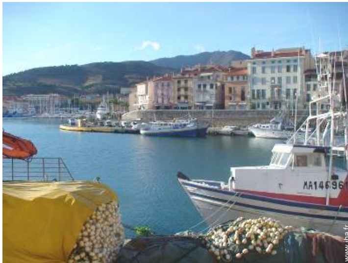
vue sur port