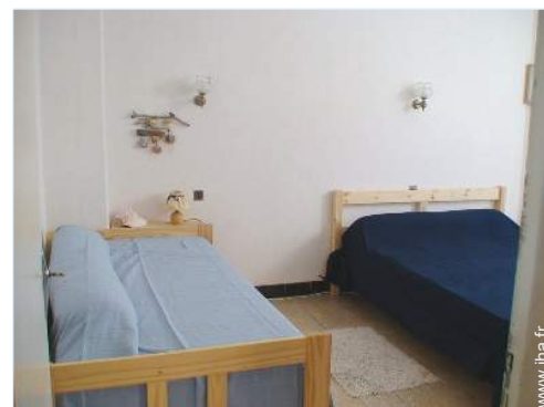
lit(s) escamotable(s) 2 pers

Barbecue, barbecue à gaz, table(s) de jardin, 6 chaise(s) de jardin, tonnelle, parasol, salon de jardin, 2 chaise(s) longue(s), 1 transat(s)