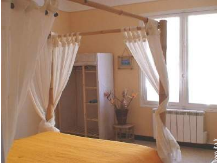
lit(s) double(s) à baldaquin