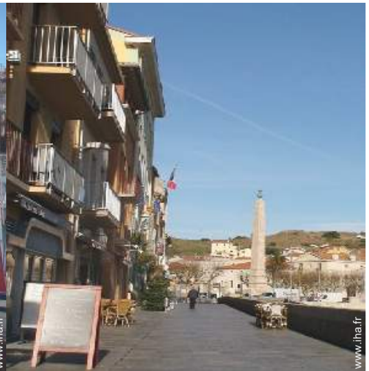
vue sur rue piétonne