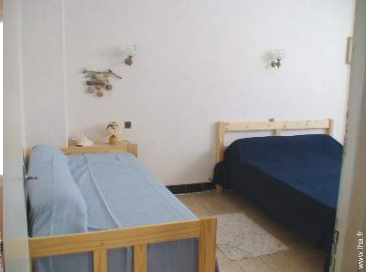
lit(s) escamotable(s) 2 pers