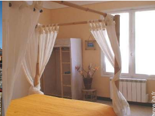
lit(s) double(s) à baldaquin