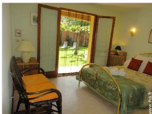
La chambre d'hôte