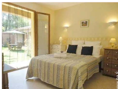
La chambre d'hôte