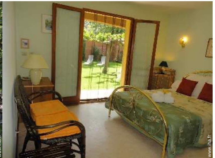
La chambre d'hôte