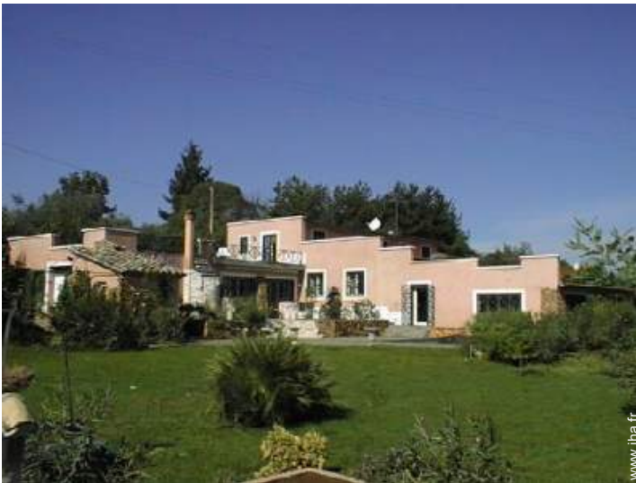
Villa de Charme