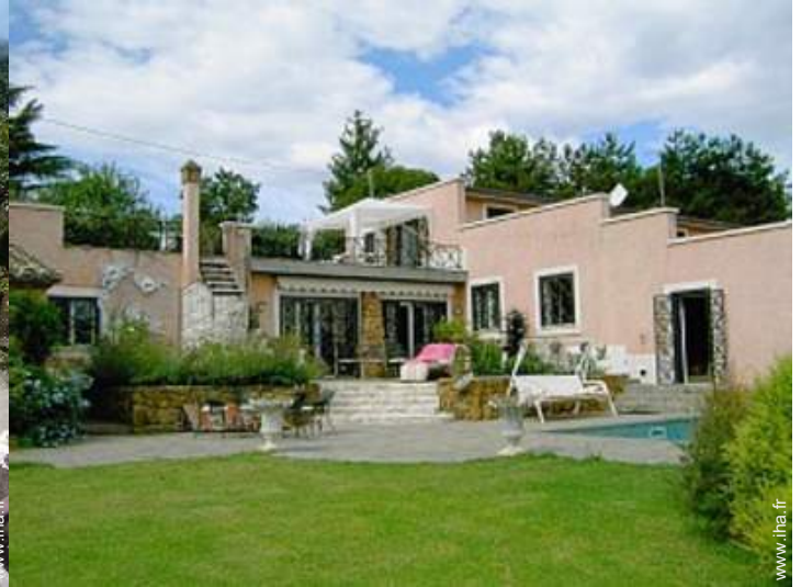
Propriété de Prestige