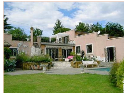
Propriété de Prestige