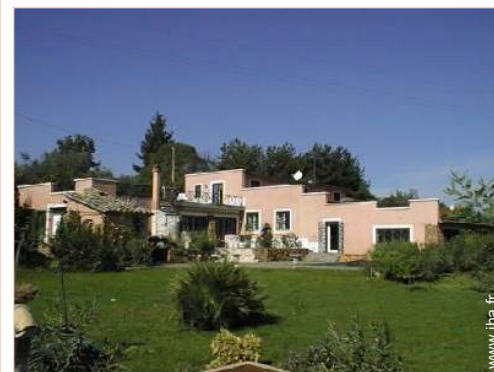
Villa de Charme