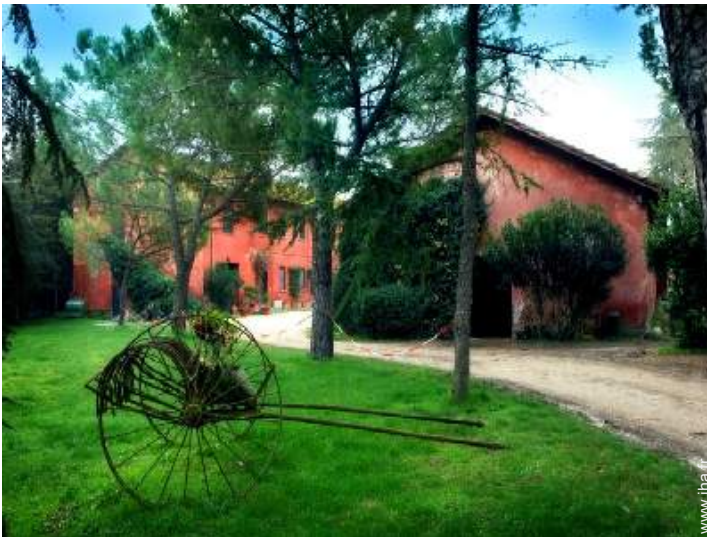
Ancienne Ferme de Charme