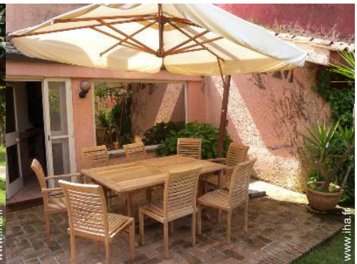
table(s) de jardin