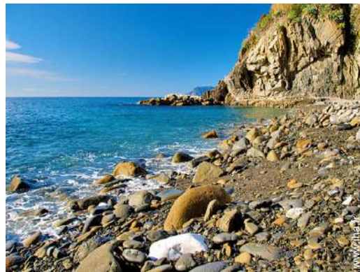
plage de galets