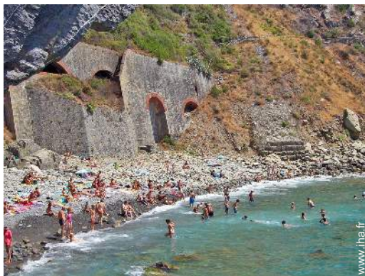
plage de galets